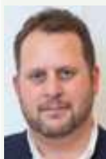
Alexander Pink Yarmouth Avocat, Pink Star Barro