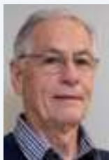
Allan Boudreau Yarmouth Juge retraité, Cour suprême de la Nouvelle-Écosse